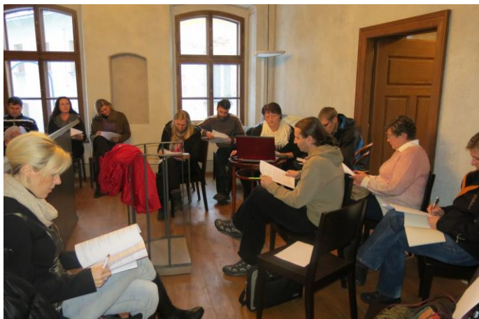
Z jednání účastníků projektu